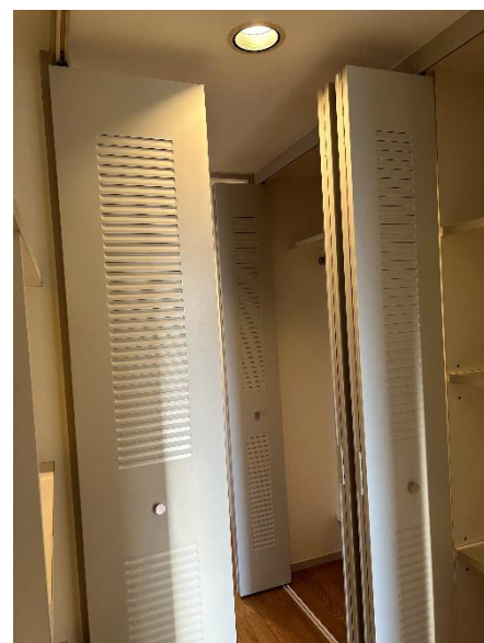
↑ 廊下内のクローゼット